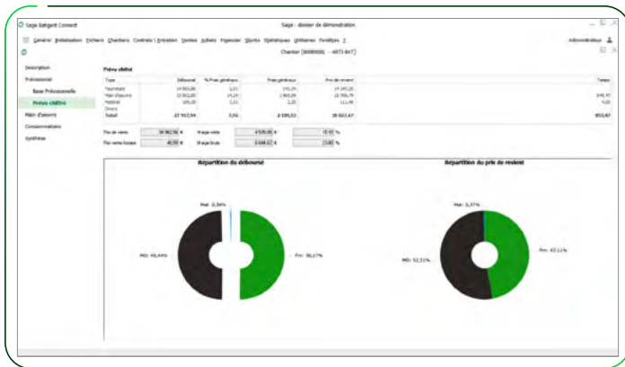
Interface chantier simplifié